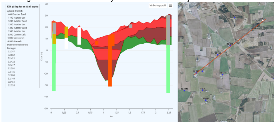
Figur 3 - Tværsnit mod sydvest

Der er også lavet et tværsnit mod sydvest til Holkasmindevej.