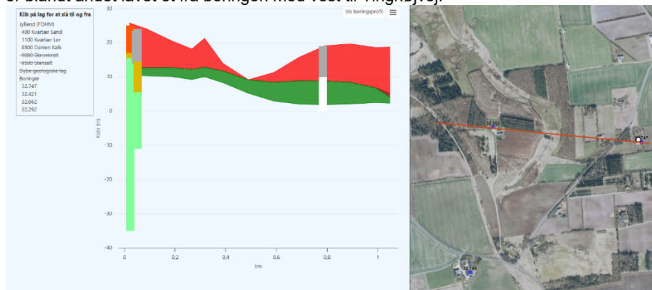
Figur 1 - Tværsnit mod vest

For at få en ide om geologien i området, er der lavet flere tværsnit i FOHM-modellen, der er blandt andet lavet et fra boringen mod vest til Tinghøjvej.