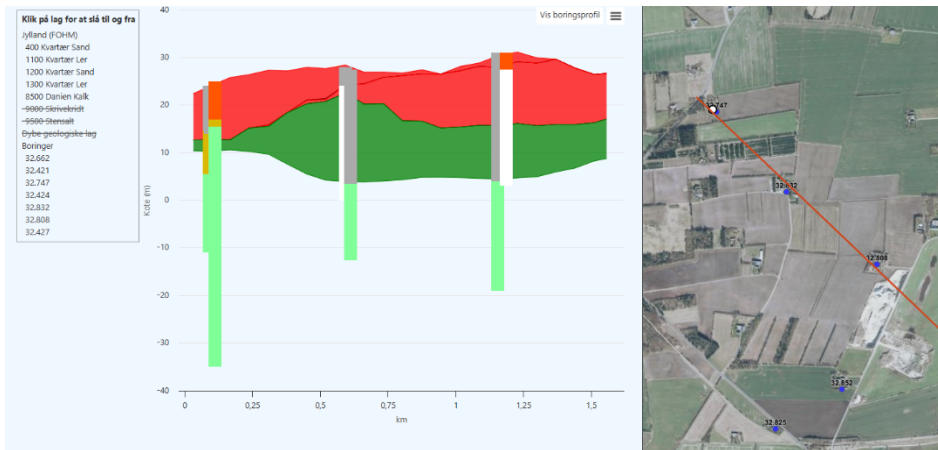
Figur 2 - Tværsnit mod sydøst

Der er også lavet et tværsnit mod sydvest til Holkasmindevej.